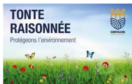
La Ville de Confolens préserve la biodiversité

Une communication spécifique a été élaborée afin de sensibiliser les habitants à cette gestion différenciée.