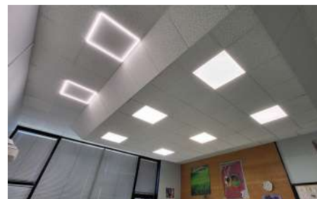
Passage au LED de l'école Pierre et Marie Curie

ÉLECTRICITÉ -> -36% (KW DE JANVIER À AVRIL)