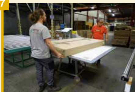
Dernière étape, l'emballage avant l'expédition.