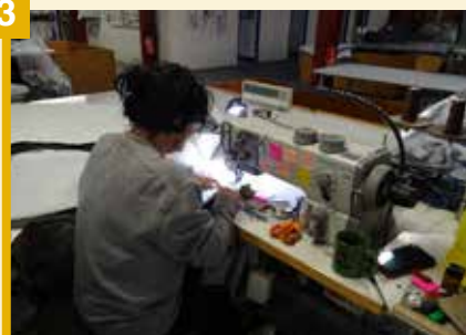
Cinq couturières font l'assemblage et le surjetage des bandes et plateaux