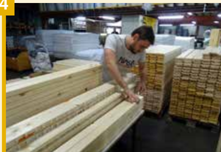
Les cadres sont réalisés, les lattes installées