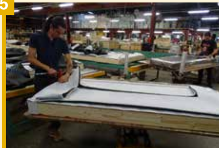
Les plateaux sont ensuite agrafés sur les cadres pour le garnissage. Pose également d'une toile noire antipoussière.