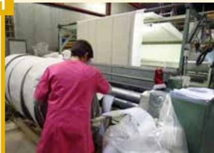
Les matières premières (feutre, ouate et tissu) arrivent de Belgique