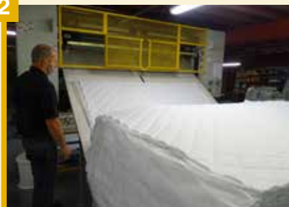
Une machine multiaiguille produit des «plateaux»