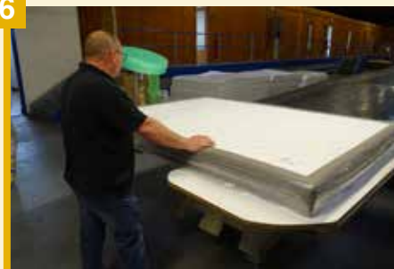
S'ensuit un contrôle de qualité pour l'étape de validation.