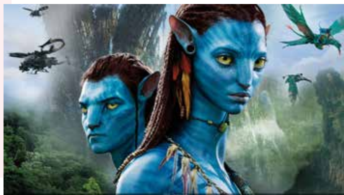
Avatar 2, La voie de l'eau