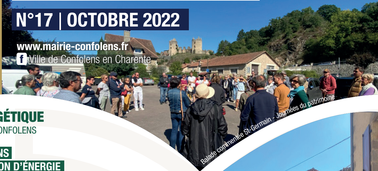
Balade commentée St-Germain - Journées du patrimoine