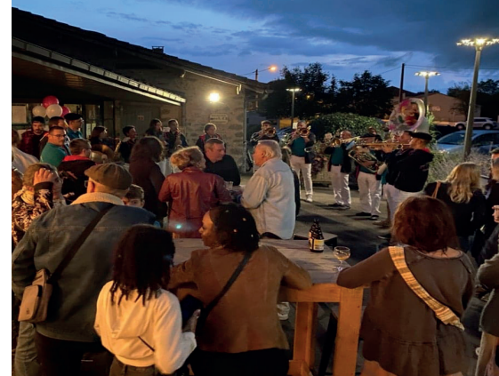
Apéro-concert - 10 ans de la Ferme St-Michel