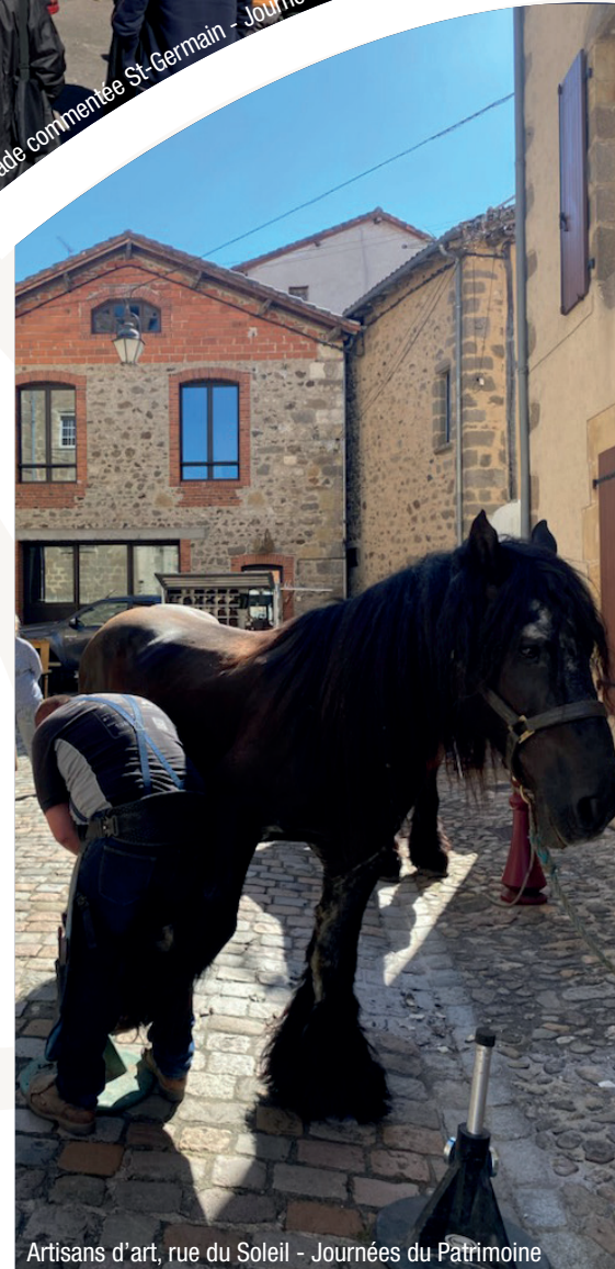
Artisans d'art, rue du Soleil - Journées du Patrimoine