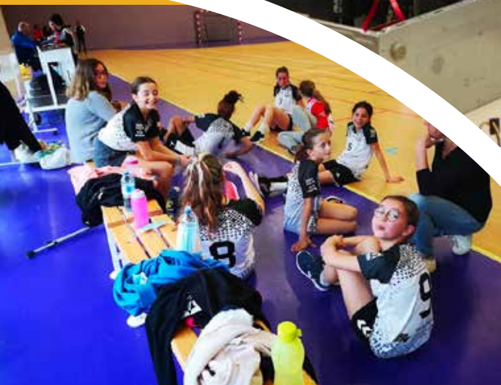
-15F Handball Club du Confolentais