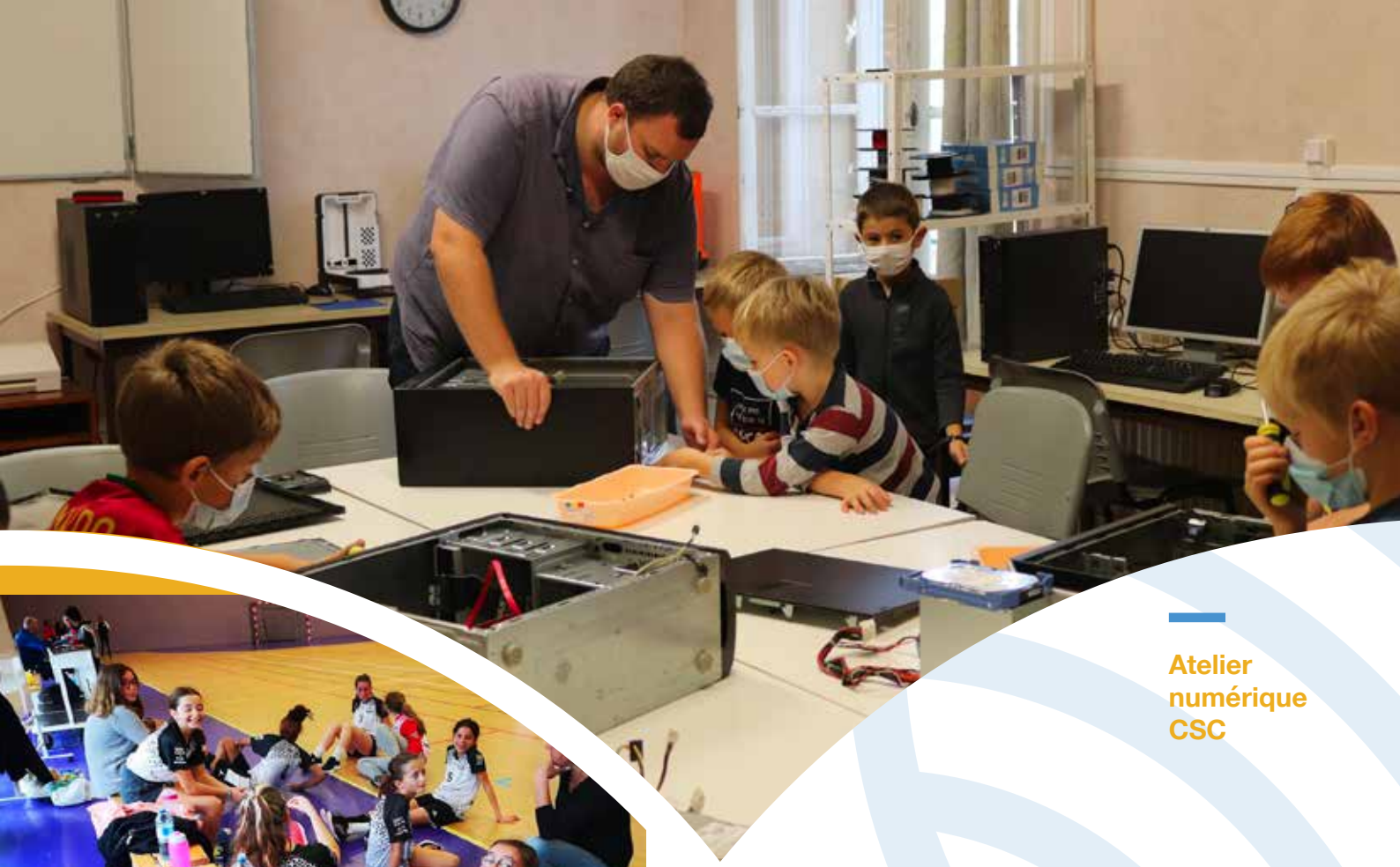
Atelier numérique CSC