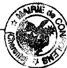
Jean-Noël DUPRÉ Maire de Confolens

Pour Extrait Conforme En Mairie, le 6 mars 2019