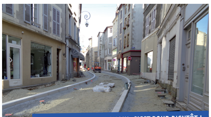
LE CENTRE-VILLE DE DEMAIN, C'EST POUR BIENTÔT !

Vos commerçants, artisans et autres services des rues du Maquis Foch et du Pont Larréguy sont évidemment ouverts pendant la durée des travaux.