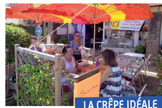
LA CRÊPE IDÉALE

Outre les commerçants et artisans, retrouvez également les services suivants : Confolens Immobilier, Banque Populaire, Mutuelle de Poitiers, Cabinet d'infirmières et praticien en psychothérapie, Crédit Lyonnais, Auto école Passion Conduite.