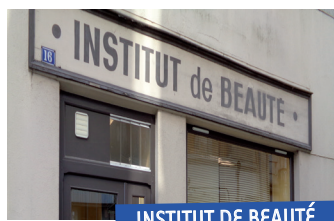
INSTITUT DE BEAUTÉ