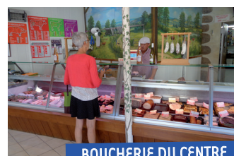
BOUCHERIE DU CENTRE