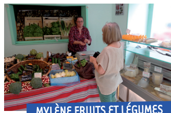
MYLÈNE FRUITS ET LÉGUMES