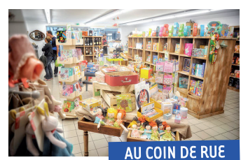
AU COIN DE RUE