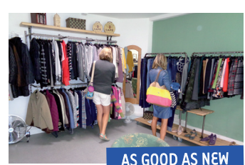
AS GOOD AS NEW