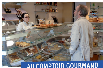
AU COMPTOIR GOURMAND